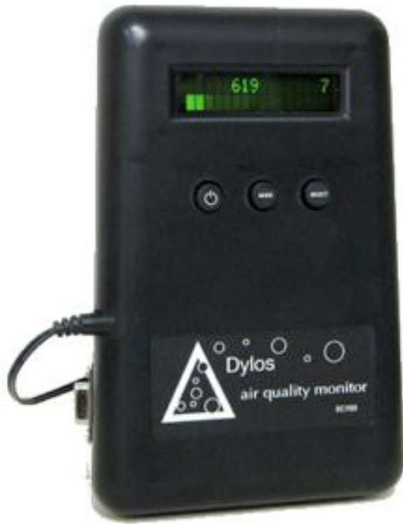
Aantal deeltjes per liter