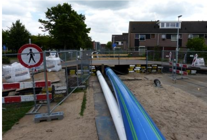
460 m. buizen liggen klaar in Holendrecht oost.