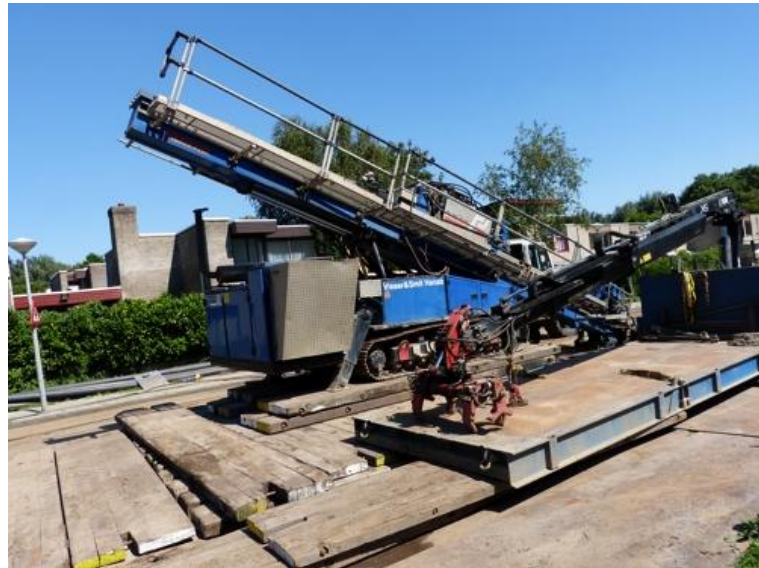
De 100-tonner staat klaar voor de laatste boring in Huntum