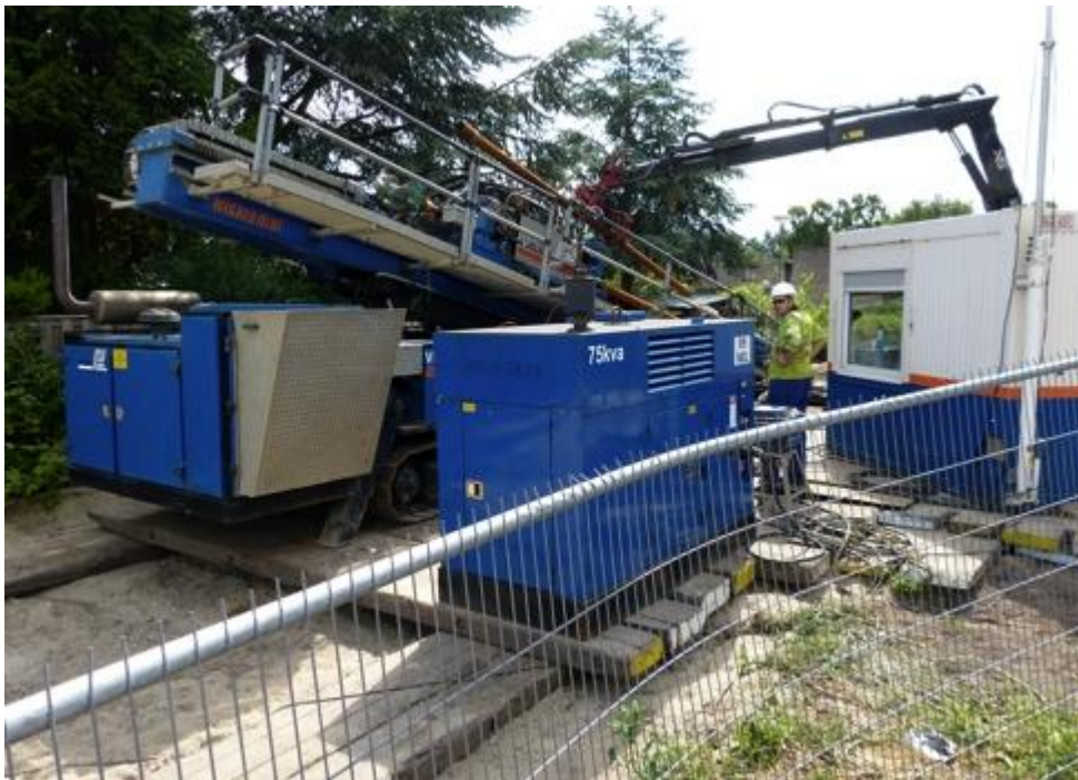
Radiografisch bestuurd wordt een nieuwe boorpijp in de machine gelegd.