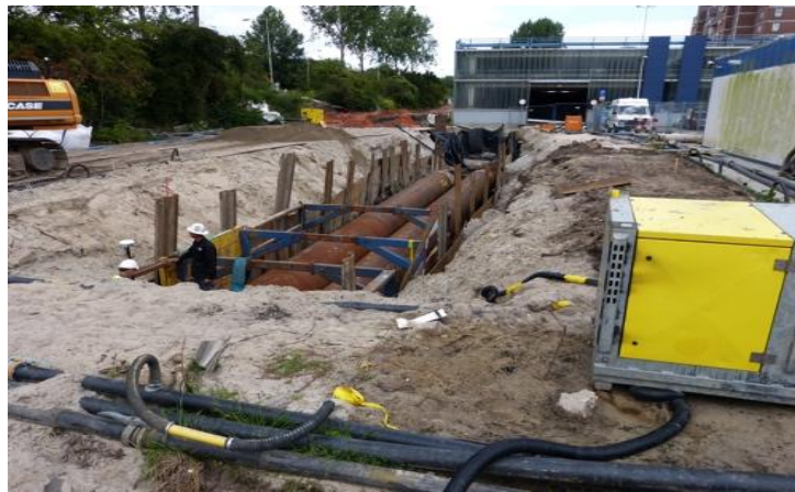
Werkzaamheden bij Leksmondhof en Leerdamhof