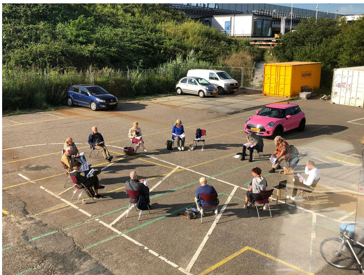
29 juli: AGG vergadert in de buitenlucht met RWS en IXAS maar wel op 1,5 meter afstand!

15 januari 2021 bestuur Stichting Aktie Gezondheid Gaasperdammerweg (AGG)