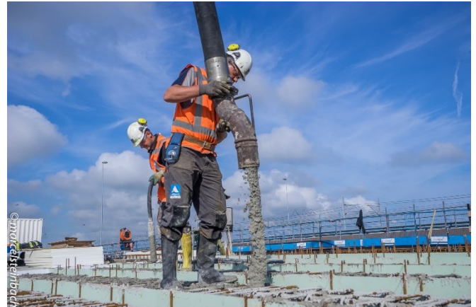
Afbeelding: Betonstort

betonstort kan tussentijds namelijk niet onderbroken worden.