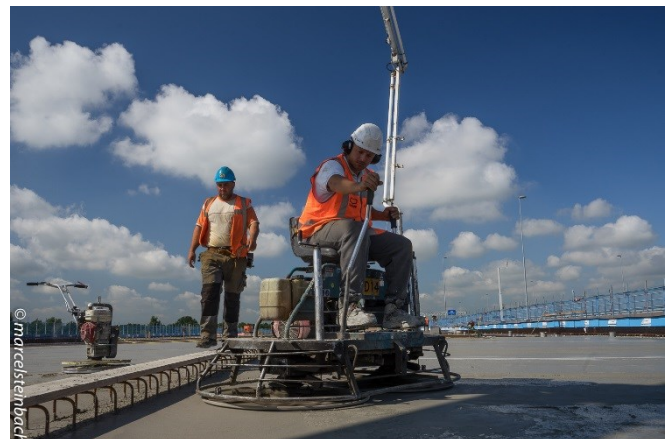
Afbeelding: Vliendermachine

Al na enkele uren is het beton 'beloopbaar'. Dan wordt de toplaag van het beton gevlienderd (opgeschuurd). Vlienderen verbetert de structuur van het beton en zorgt ervoor dat overtollig water kan wegstromen. In de herfst en in de winter kan het langer duren voordat het beton beloopbaar is, daardoor kan het voorkomen dat we in de avond en nacht vlienderen.